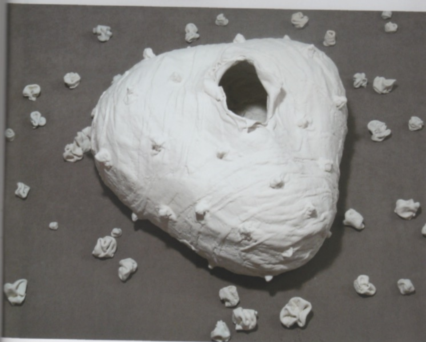
Amparo Almela, boven: Eclosiones en grès , 2011; grès, vulkanische glazuren, 1250° C; gemiddeld h. 35 x 80 x 100 cm | onder: Eclosiones (Uitkomen, Ontkiemen) , 2010; porselein, stof; h. 45 x 130 x 130 cm