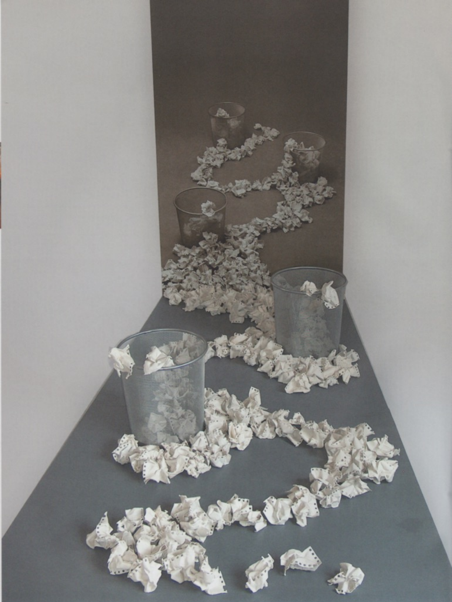
Amparo Almela, Fuga de ideas , 2007; porselein, fotografie; h. 160 x 75 x 190 cm