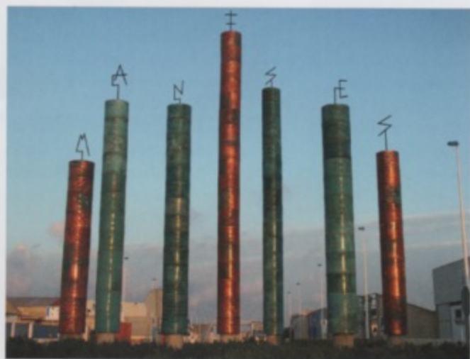
Amparo Almela, Zeven Pilaren in Manises, 2004; steengoed, lusters, h. 300-700 cm, Ø 30-40 cm, totale Ø 600 cm